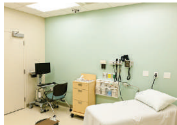
Ambulatori medici o dentistici