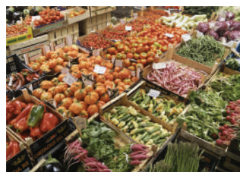
Magazzini conservazione frutta e verdura