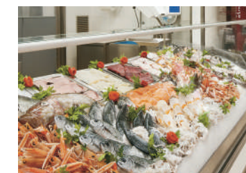
Magazzini conservazione pesce