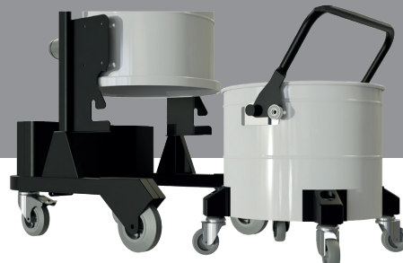
Sistema agevole di sgancio del fusto