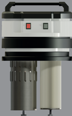
Testata con sistema di pulizia del filtro automatica integrata ICLEAN.